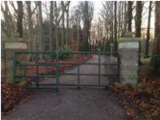
Ingang Landgoed Leusderend vanaf bushalte